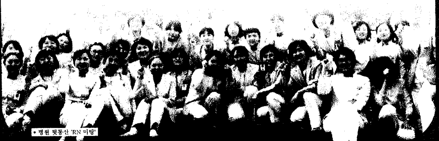
* 병원 뒷동산 'RN 미팅'